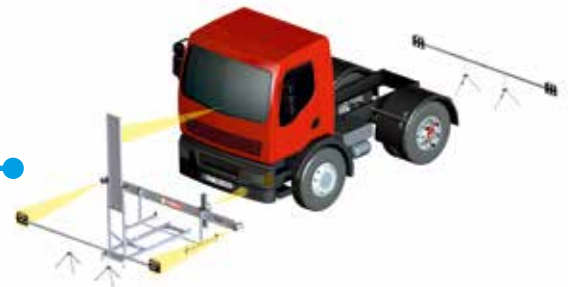
Die Mess-Traverse und der Kalibrierreflektor stehen waagrecht ausgerichtet in einem exakten Abstand vor dem Fahrzeug.

QuickService Funktionen: Globales Scannen aller Steuergeräte • ADAS Kalibrierung • Einstellung der Lenkwinkelsensoren • viele weitere Funktionen möglich