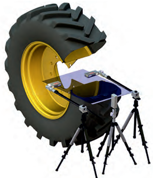
System mit 3 Messköpfen